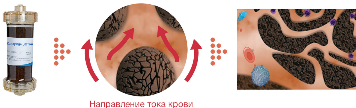
Направление тока крови

При перфузии крови через сорбент, заполняющий картридж, целевые молекулы проникают в поры гранул и адсорбируются за счет гидрофобного и ионного взаимодействия. Форменные элементы крови не взаимодействуют с сорбентом.